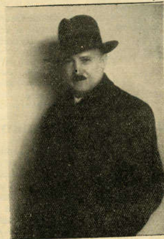
Станислав Бинички први директор Опере нашег Позоришта

Станислав Бинички рођен је 14 јула 1872 године у селу Јасици, у округу моравском. Учио је гимназију у Нишу и Београду. Већ у вишим разредима гимназије почиње да компонује. По свршеној матури у нишкој гимназији, Бинички 1890 године долази на Велику школу и за све време студија на Филозофском факултету бави се музиком. Под утицајем Стевана Мокрањца одлази на музичке студије у Минхен, као државни стипендиста.