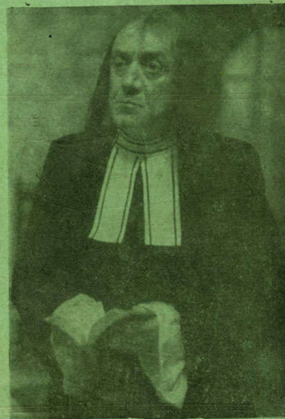
Г. Страхинја Петровић у улози Тартифа